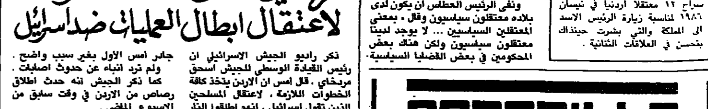
جانر امس الاول بغير سبب واضح. ولم ترد انباء عن حدوث اصليات. كما ذكر الجيش انه حدث اطلاق رصاص من الارض في وقت سابق من الاسبوع الماضي. وقال مشق تبت منظمة فتح - الانتقضاة. امس الهجومين على دوريات اسرائيلية على خط وقف اطلاق النار بين اسرائيل والارض يوم الخميس وامس الاول. وقالت المنظمة في بيان وزعته على الصحافة. ان احدى مجموعتنا العاملة داخل الارض. ملحت امس الاولى دورية عسكرية اسرائيلية في منطقة الحمة قرب الحدود الاردنية - الاسرائيلية قتلت او جرحت جميع افرادها القدس المحتلة. ر. ا. ف. ب.

تكر رابع الجيش الاسرائيلي رئيس القيادة الوسطى للجيش اسحق مريخاي. قال امس ان الارض يتخذ كافة الخطوات اللازمة. لاعتقال المسلحين الذين تقول اسرائيل. انهم اطلقوا النار مرتين على دوريتها الحدودية امس الاول. وقام مريخاي امس بجولة في المنتزه السليحي الواقع في حمة جابر بالقرب من الحدود الاردنية حيث قالت مصادر الجيش الاسرائيلي ان مسلحين من الارض اطلقوا النار على قوات اسرائيلية مرتين امس الاول. وتكرت المصادر ان الاسرائيليين رخوا باطلاق النار. وفي عمان قال متحدث باسم الحكومة لوكالة الانباء اردنية (بئرا) ان القوات الاسرائيلية قتمت النار في منطقة حمة